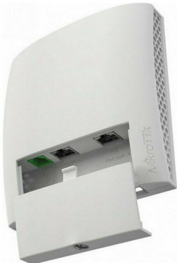
Фото Точка доступа MikroTik wsAP ac lite (RBwsAP-5Нac2nD)

Отправьте запрос на коммерческое предложение и получите индивидуальные цены и сроки поставки