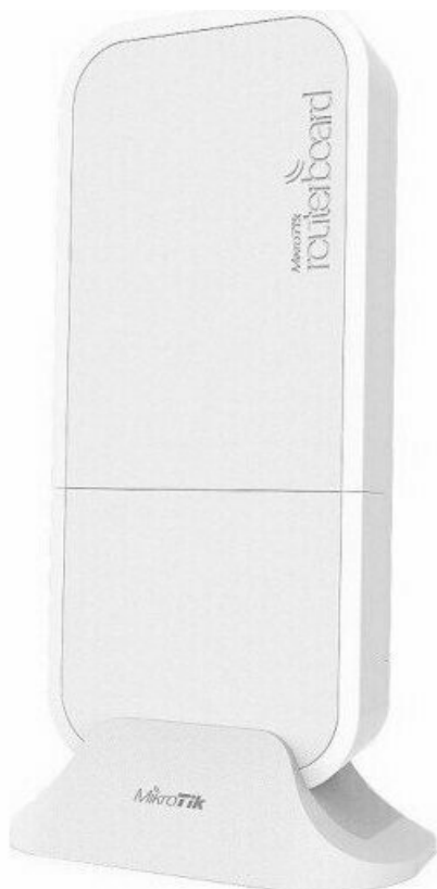
Фото Точка доступа MikroTik wAP ac LTE6 kit (RBwAPGR-5HacD2HnD&R11e-LTE6)

Отправьте запрос на коммерческое предложение и получите индивидуальные цены и сроки поставки