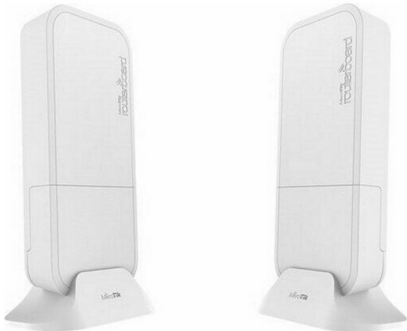
Фото Комплект точек доступа MikroTik Wireless Wire (RBwAPG-60adkit)

Отправьте запрос на коммерческое предложение и получите индивидуальные цены и сроки поставки