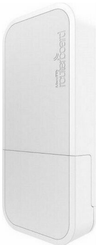
Фото Точка доступа MikroTik wAP 60Gx3 AP (RBwAPG-60ad-SA)

Отправьте запрос на коммерческое предложение и получите индивидуальные цены и сроки поставки