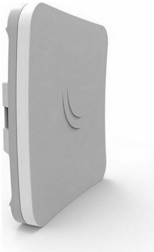
Фото Точка доступа MikroTik SXTsq Lite5 (RBSXTsq5nD)

Отправьте запрос на коммерческое предложение и получите индивидуальные цены и сроки поставки