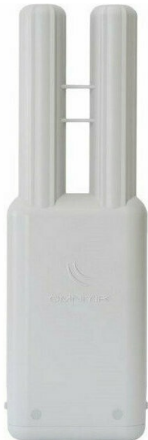
Фото Точка доступа MikroTik OmniTik 5 (RBOmniTikU-5HnD)

Отправьте запрос на коммерческое предложение и получите индивидуальные цены и сроки поставки