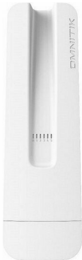
Фото Точка доступа MikroTik OmniTik 5 ac (RBOmniTikG-5НacD)

Отправьте запрос на коммерческое предложение и получите индивидуальные цены и сроки поставки