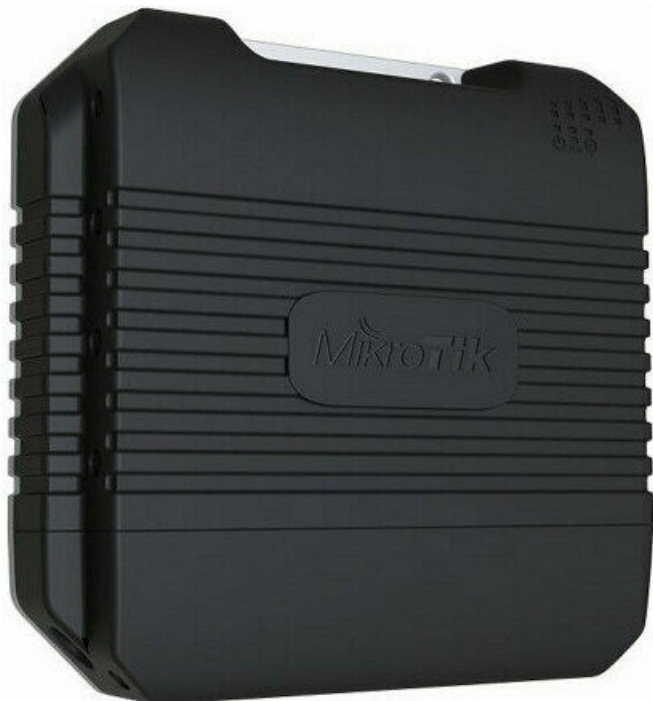
Фото Точка доступа MikroTik LtAP (RBLtAP-2HnD)

Тел: +7 499 959-25-60 | Email: sale@ru-mikrotik.com | https://ru-mikrotik.com