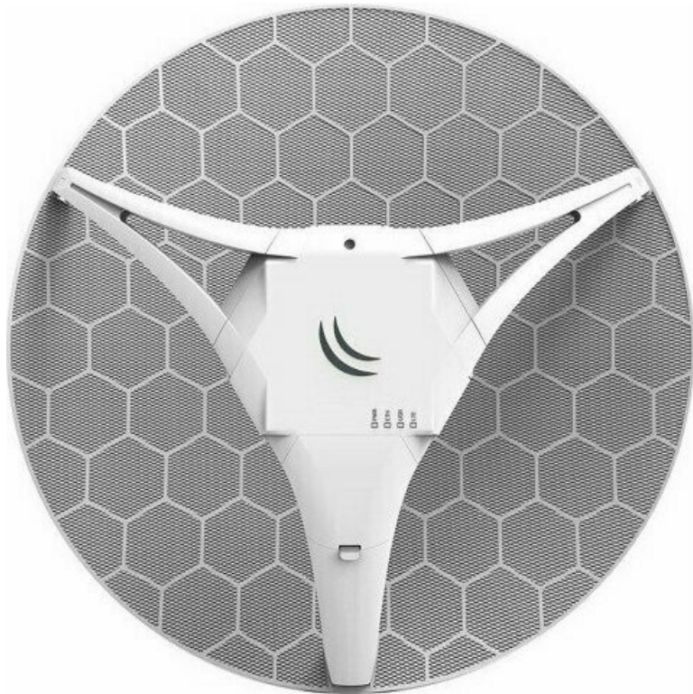
Фото Точка доступа MikroTik LHG R (RBLHGR)

Отправьте запрос на коммерческое предложение и получите индивидуальные цены и сроки поставки