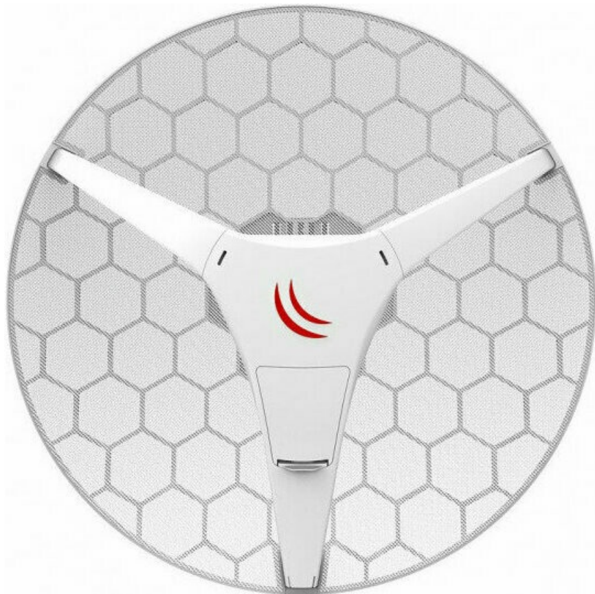
Фото Точка доступа MikroTik LHG 60G (RBLHGG-60ad)

Отправьте запрос на коммерческое предложение и получите индивидуальные цены и сроки поставки