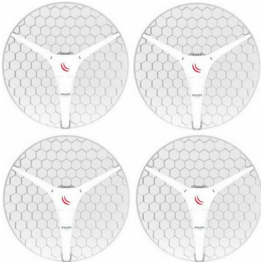
Фото Точка доступа MikroTik LHG XL HP5 4pack (RBLHG-5HPnD-XL4pack)

Отправьте запрос на коммерческое предложение и получите индивидуальные цены и сроки поставки