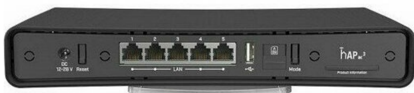
Фото LTE роутер MikroTik hAP ac3 LTE6 kit (RBD53GR-5HacD2HnD&R11e-LTE6)

Отправьте запрос на коммерческое предложение и получите индивидуальные цены и сроки поставки