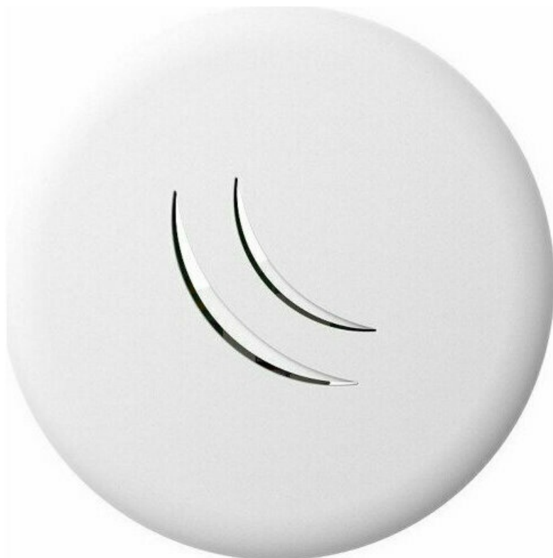
Фото Точка доступа MikroTik сAP lite (RBсAPL-2nD)

Отправьте запрос на коммерческое предложение и получите индивидуальные цены и сроки поставки