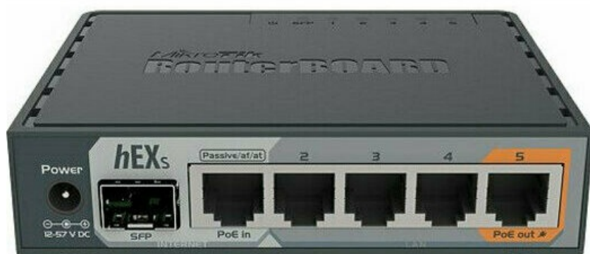
Фото Маршрутизатор MikroTik hEX S (RB760iGS)

Отправьте запрос на коммерческое предложение и получите индивидуальные цены и сроки поставки