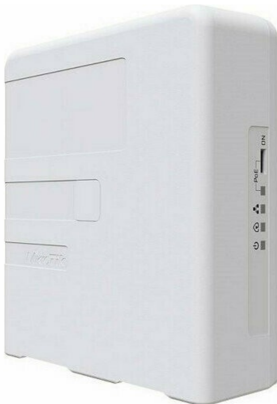
Фото PowerLine адаптер MikroTik PWR-LINE PRO (PL7510Gi)

Отправьте запрос на коммерческое предложение и получите индивидуальные цены и сроки поставки