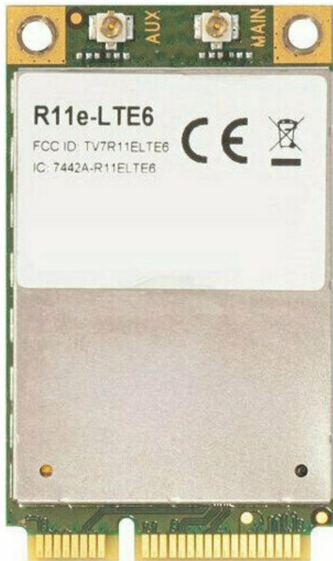
Фото LTE модем (miniPCI-e карта) MikroTik R11e-LTE6

Отправьте запрос на коммерческое предложение и получите индивидуальные цены и сроки поставки