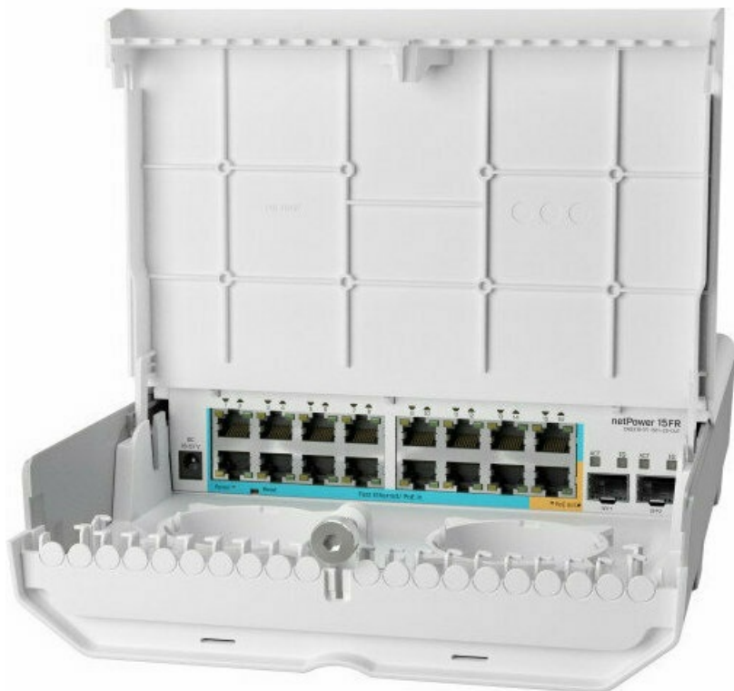
Фото Коммутатор MikroTik netPower 15FR (CRS318-1Fi-15Fr-2S-OUT)

Отправьте запрос на коммерческое предложение и получите индивидуальные цены и сроки поставки