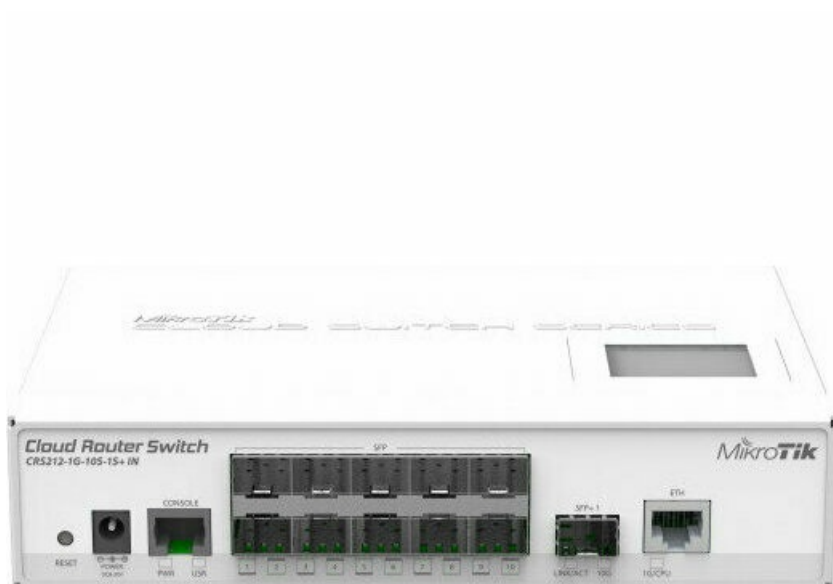
Фото Коммутатор MikroTik Cloud Router Switch 212-1G-10S-1S+IN (CRS212-1G-10S-1S+IN)

Отправьте запрос на коммерческое предложение и получите индивидуальные цены и сроки поставки