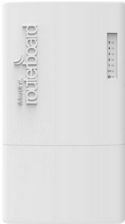
Фото Коммутатор MikroTik FiberBox (CRS105-5S-FB)

Отправьте запрос на коммерческое предложение и получите индивидуальные цены и сроки поставки