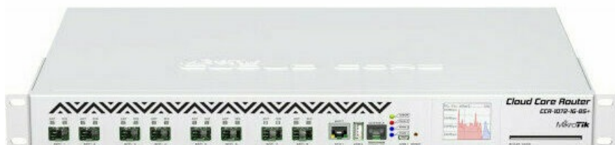
Фото Маршрутизатор MikroTik Cloud Core Router 1072-1G-8S+ (CCR1072-1G-8S+)

Отправьте запрос на коммерческое предложение и получите индивидуальные цены и сроки поставки