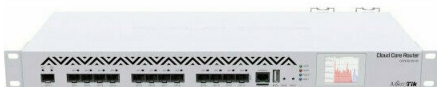
Фото Маршрутизатор MikroTik Cloud Core Router 1016-12S-1S+ (CCR1016-12S-1S+)

Отправьте запрос на коммерческое предложение и получите индивидуальные цены и сроки поставки