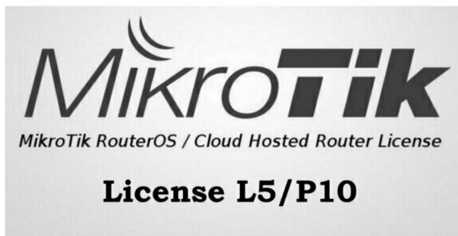
Фото License L5/P10

Отправьте запрос на коммерческое предложение и получите индивидуальные цены и сроки поставки