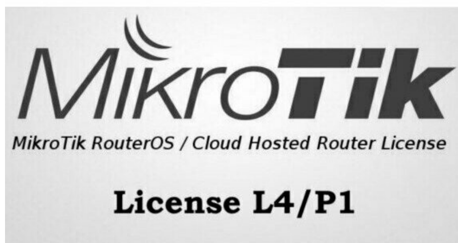
Фото License L4/P1

Отправьте запрос на коммерческое предложение и получите индивидуальные цены и сроки поставки