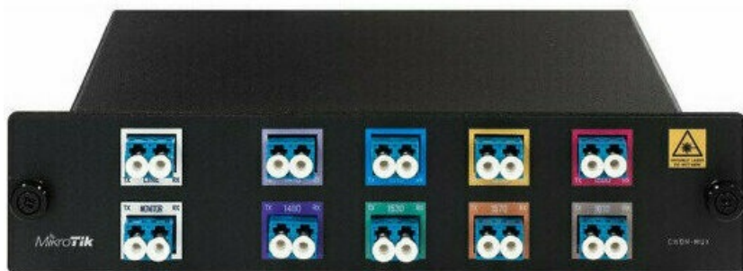
Фото Мультиплексор MikroTik CWDM-MUX8A

Отправьте запрос на коммерческое предложение и получите индивидуальные цены и сроки поставки