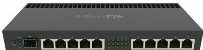
Фото Маршрутизатор MikroTik RouterBOARD RB4011iGS+RM

Отправьте запрос на коммерческое предложение и получите индивидуальные цены и сроки поставки